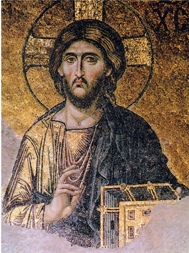
"Deesis" della tribuna sud (metà sec. XIII) Santa Sofia - Istanbul