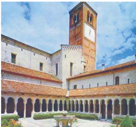
Abbazia di Follina